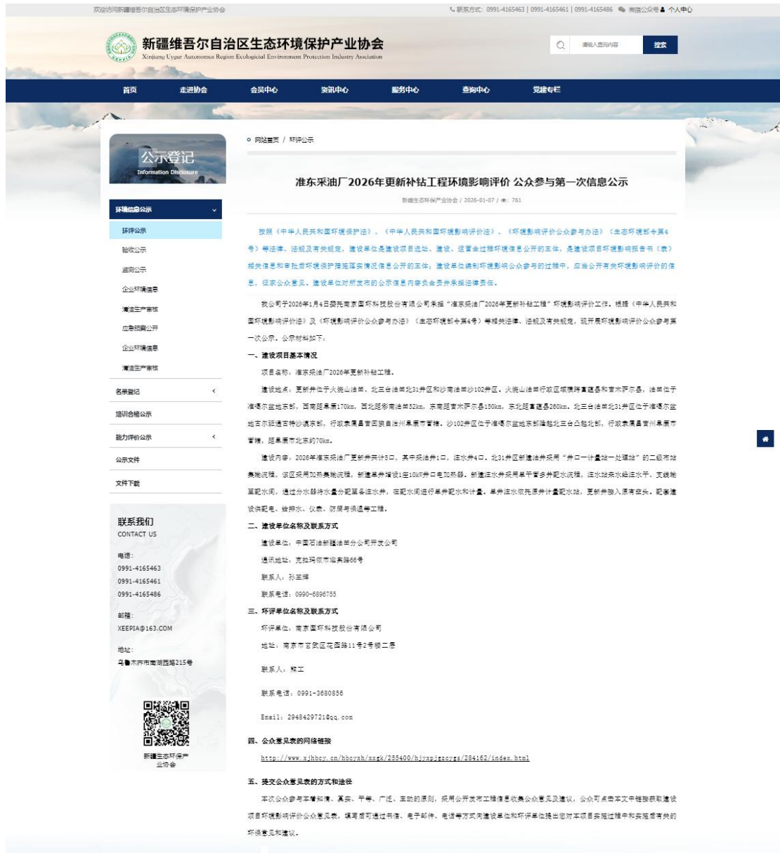
图 2.2-1 第一次网络公示