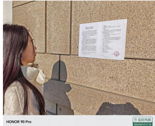
图 3.2-4 张贴公示