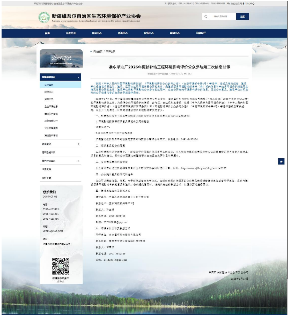
图 3.2-1 第二次网络公示